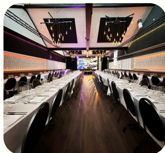
Møde og konference