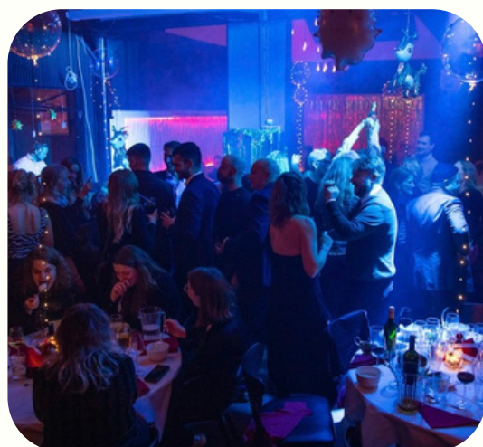
Events og fester